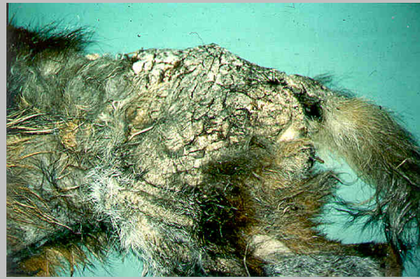
Abb. 3. Nahaufnahme von Abb. 2., Lumbalbereich.