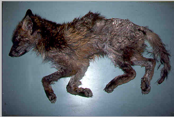
Abb. 2. Rüdiger Fuchs: Der Haarausfall und die dicken Krusten mit Ragaden ist im Lumbalbereich gut sichtbar.